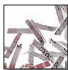
Coupe croisée 2 x 15 mm Niveau de sécurité DIN 4 Documents confidentiels ou secrets.