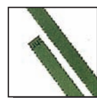
Coupe fibres 4 mm Niveau de sécurité DIN 2 Documents internes.