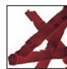
Coupe croisée 4 x 40 mm Niveau de sécurité DIN 3 Documents confidentiels.